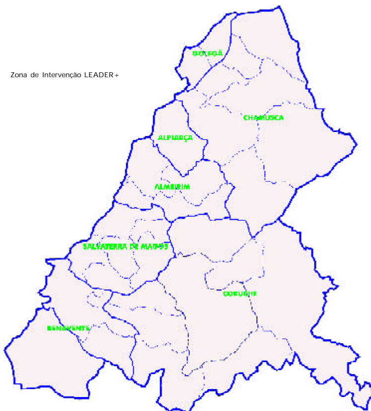
Zona de Intervenção LEADER+

A par da dinâmica museológica, procura-se manter o saber-fazer tradicional. Tanoaria, latoaria, brinquedos de madeira, cestaria, colheres de pau, trabalhos em ferro forjado e madeira, pintura em vidro, rendas, talha, tapeçaria, trapologia, cestaria em vime, gulosas e esteirinhas de junco ou correntes de seda de cavalo, são alguns exemplos mais emblemáticos. Sem esquecer a gastronomia, conhecida pela sopa de pedra de Almeirim, complementada pela massa à barrão, enguias fritas, carneiro à moda de Alpiarça, miga fervida, sopa da Matança, ou molhinhos grelhados, além das broas, ferraduras, pão-de-ló, trouxas de ovos, peixe doce, queijinhos de amêndoa, ou lampreia de ovos. E os vinhos com denominação de origem, de Almeirim (engloba concelho de Alpiarça e parte de Salvaterra de Magos) e Coruche (parte de Salvaterra de Magos e Benavente).