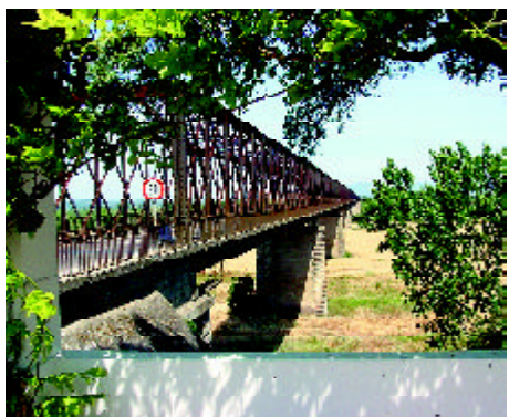
Ponte da Chamusca