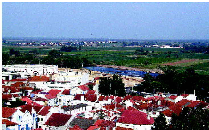
Coruche / João Limão