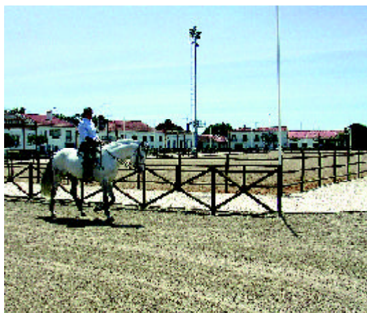
Golegã / João Limão